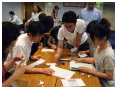
昨年度研修ワークショップの様子